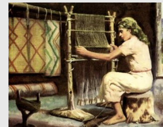
Rekonstrukciós kép – szövést álló szövőszéken